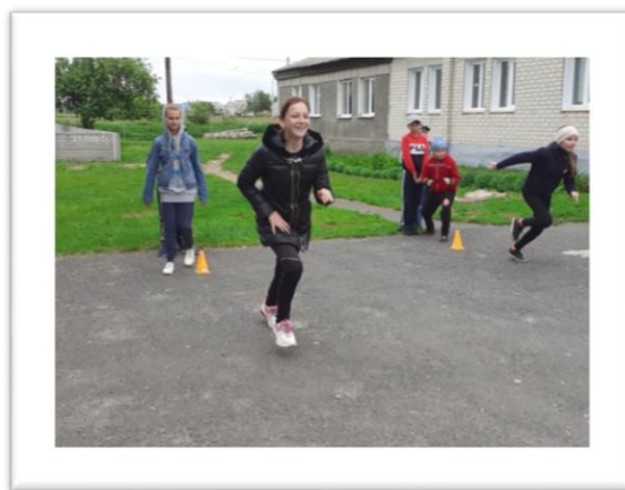
Конкурс «Бег чемпионов»

Соревнования стали настоящим праздником спорта и здоровья! Участвуя в «Веселых стартах», дети почувствовали себя большой единой семьей!